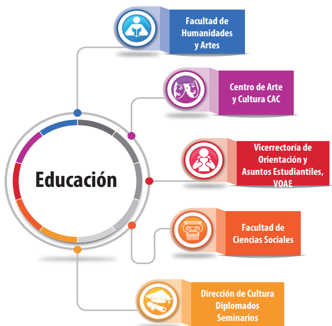
Figura 4. Instancias relacionadas con la gestión del patrimonio cultural universitario