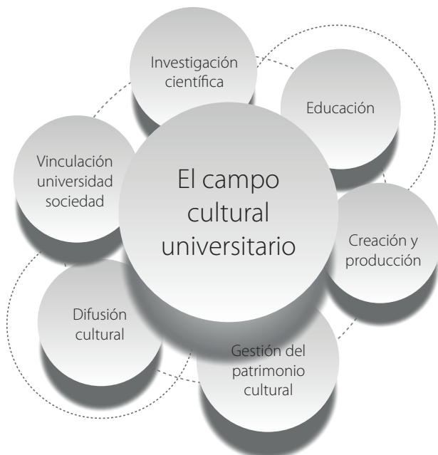
Figura 2. Principales instancias que realizan investigación científica