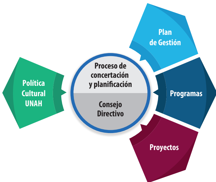
Figura 7. Procesos del Sistema Universitario de Gestión Cultural